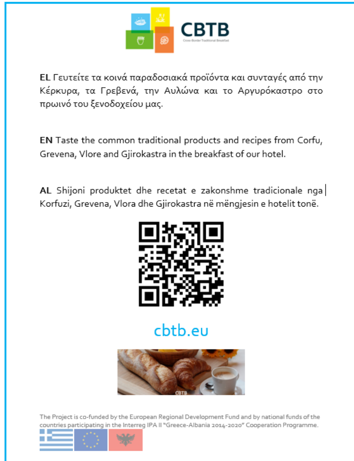
Εικόνα 2: Ενημερωτικό πάγκου CBTB Πρωινού (Υπόδειγμα)