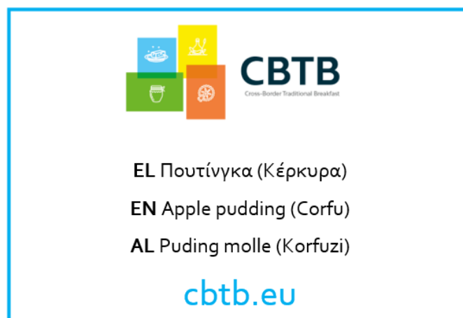
Εικόνα 4: Καρτελάκι προϊόντος CBTB Πρωινού (Υπόδειγμα)

Στη συνέχεια, παρουσιάζεται σχέδιο για το καρτελάκι που προετοίμασε η Living Prospects. Το πρότυπο για το καρτελάκι θα οριστικοποιηθεί σε συνεννόηση με τον Επικεφαλής εταίρο του έργου και το Επιμελητήριο Κέρκυρας.